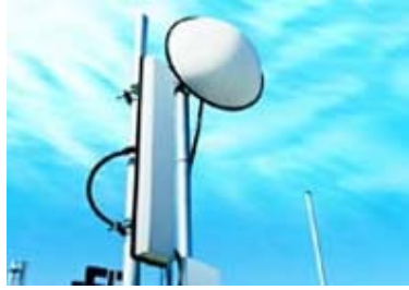
Gambar 5. WiMax tower.