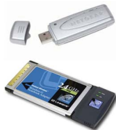
Gambar 3. Wireless Adapter yang dipasangkan ke USB port dan PC card slot .

Dengan menggunakan teknologi wireless ini, tidak menutup kemungkinan orang untuk membuat jaringan wireless sendiri di rumah dengan menggunakan wireless access point . Untuk membuat sebuah jaringan wireless , user memerlukan alat yang disebut dengan wireless router . Wireless router merupakan suatu alat yang di dalamnya terdapat sebuah port untuk menghubungkan kabel atau modem DSL, sebuah router , sebuah hub Ethernet, firewall , serta wireless access point . Wireless router ini memungkinkan user untuk menggunakan sinyal radio atau kabel Ethernet untuk menghubungkan komputer-komputer satu dengan yang lainnya – atau dengan kata lain membuat suatu jaringan – serta menghubungkan jaringan-jaringan tersebut dengan printer atau ke internet secara langsung. Jangkauan wireless router ini dapat mencapai hingga 30,5 meter ke seluruh penjuru walaupun terhalang dengan tembok atau benda lainnya. Berikut ini merupakan gambar contoh salah satu wireless router (Brain & Wilson, 2008).