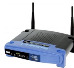
Gambar 4. Wireless Router .

Sama dengan wireless adapter yang dapat memiliki standar 802.11 lebih dari satu dalam satu alat yang sama, wireless router juga dapat memiliki standar 802.11 lebih dari satu. Tentu saja wireless router yang memiliki standar lebih dari satu akan berharga lebih mahal jika dibandingkan dengan wireless router yang hanya memiliki satu standar. Namun apabila harus memilih salah satu, pengguna pada umumnya lebih percaya dengan menggunakan standar 802.11g karena kecepatan yang tergolong cepat dengan keamanan serta kepercayaan yang mencukupi.