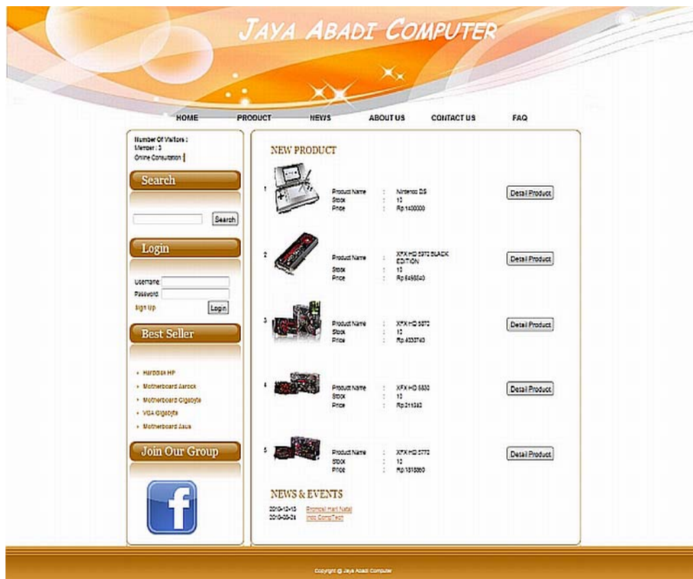
Gambar 2. Antarmuka produk-produk JAC.

Tahap pertama adalah awareness , yaitu kesadaran calon pelanggan mengenai keberadaan JAC. Beberapa usaha yang dilakukan adalah: melakukan promosi, melakukan pemasangan standing banner di depan toko sehingga orang-orang yang lewat menjadi tahu kalau sedang mengadakan promosi, ikut serta dalam pameran yang biasa diadakan di Jakarta. Kota Jakarta dipilih karena merupakan ibukota sehingga diharapkan orang yang datang dapat berasal dari berbagai daerah dan juga untuk menjaring pelanggan-pelanggan baru yang potensial. Pemberian nama website yang dimiliki berdasarkan pada nama toko yaitu www.JAC.web.id Pemberian nama tersebut dengan tersebut dengan tujuan agar mudah mengingatnya.