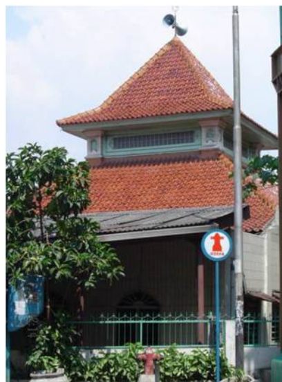
Gambar 5. Masjid Kampung Baru (Prihamdani, 2011).

Masjid yang terletak di Bandengan Selatan ini (Gambar 5) didirikan oleh pedagang India yang beragama Islam. Denah dasarnya berbentuk persegi, atapnya tumpang satu dengan atap corak limasan pada bagian atasnya, sedangkan limas bawah seperti terpancung sehingga digolongkan tipe masjid Jawa gaya pendopo. Di dalam masjid terdapat ukiran buah anggur yang indah.