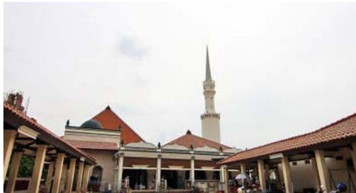
Gambar 4. Masjid Luar Batang (Gunawan, 2011).

sehingga rata dengan lantai masjid baru yang sudah dibangun di belakangnya. Hal ini dianggap perlu karena kelembaban tanah.