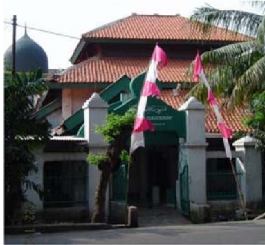
Gambar 9. Masjid Al-Mukarromah (Tarekat Qodiriyah, 2011).

Masjid Al-Mukarromah (Gambar 9) didirikan di jalan Lodan (1715 makam) oleh Sayid Abdul Rahman bin Alwi as-Syathini.