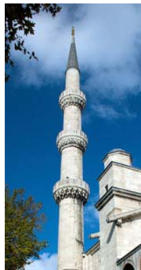
Gambar 1. Minaret Blue Mosque, Istanbul.

Sekarang minaret menjadi simbol Islam namun bukan simbol yang dalam secara teologi. Minaret modern menyediakan ruang lebih untuk hal-hal yang bersifat artistik. Lantai dasar minaret selalu berbentuk kotak/persegi dan menaranya dapat berbentuk bermacam-macam dari persegi hingga lingkaran namun kebanyakan berbentuk oktagon. Puncak dari bangunan ini merupakan tempat di mana muazin ataupun alat pengeras suara (loudspeaker) mengumandangkan adzan.