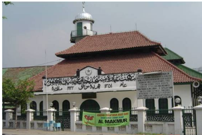
Gambar 10. Masjid Al-Makmur (Kaskus, 2011).

Masjid Al-Makmur (Gambar 10) berada di pekarangan Raden Saleh, Cikini. Masjid ini merupakan pindahan dari sebuah mushollah/masjid sederhana dari kayu dan gedek yang ada sejak 1859 yang pernah berada dalam kebun luas pelukis termasyur Raden Saleh. Menara masjid ini 'luar' biasa untuk Jakarta karena tidak lancip ke atas melainkan berbentuk kubah.