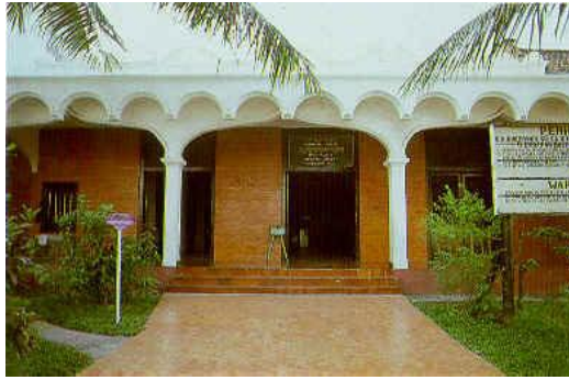
Gambar 6. Masjid an Nawier (Wisata Melayu, 2012).