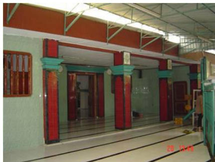
Gambar 7. Masjid Tambora.

Masjid yang terletak di jalan Tambora IV (Gambar 7) ini dibangun oleh orang Tionghoa muslim. Terlihat pengaruh arsitektur tionghoa yang sangat kental pada cungkup, mihrab, dan kaki sokogurunya.