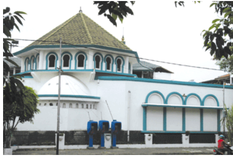
Gambar 8. Masjid Kebon Jeruk (Mesjid Jami Kebon Jeruk, 2009).