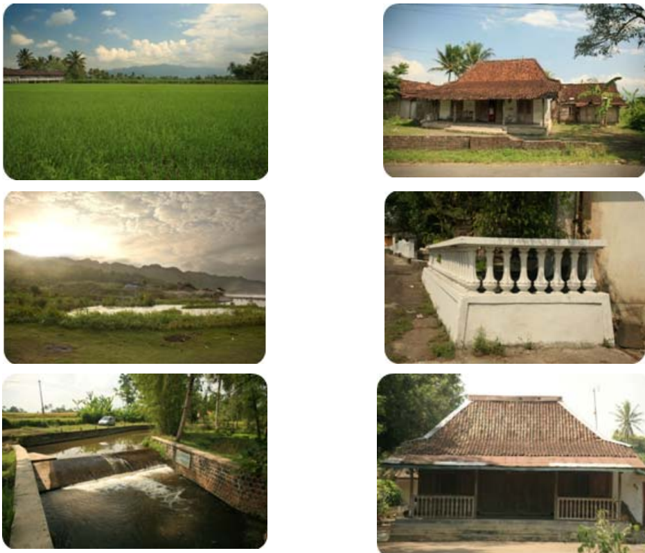
Gambar 10 Hasil Studi Lapangan

Seperti yang telah disinggung sebelumnya, setting cerita ini berada di desa Maju Makmur, representasi imajiner sebuah desa di Jawa (Tengah). Sebagai referensi dan objek survei adalah daerah Muntilan, perbatasan Jogja-Magelang. Berikut adalah foto-foto referensi hasil penelitian langsung ke lapangan, dan bagaimana visual setelah ditransformasikan dalam format CG hasilnya adalah sebagai berikut: