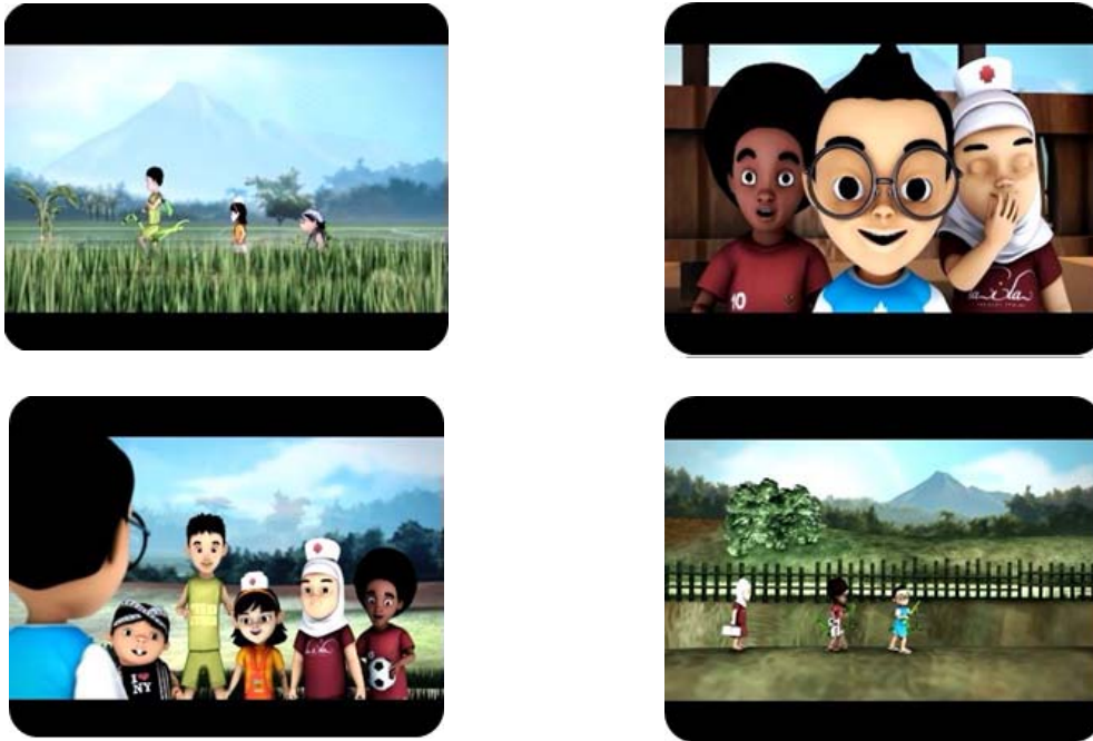
Gambar 15 Screenshot Adegan dalam Episode 1 Jambul