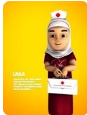
Gambar 9 Karakter Laila

menolong teman-temannya tetap tenang dan tabah menghadapi saat-saat genting. Ketenangan sangat diperlukan untuk mendapatkan solusi terbaik dalam setiap permasalahan.