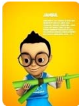
Gambar 4 Karakter Jambul

Jambul sebelumnya tinggal di kota, tetapi karena ayahnya yang pegawai pemerintah dipindahkan ke desa Maju Makmur (yang kebetulan juga tempat tinggal kakek neneknya), mau tidak mau dia harus mengikuti ayahnya. Jambul dikenal cerdas dan punya segudang ide. Kegemarannya membaca ditambah rasa ingin tahunya selalu mendorongnya menemukan hal-hal menarik yang kemudian sering berubah menjadi petualangan. Jambul jago dalam urusan matematika dan ilmu alam, dia sering kali melakukan eksperimen sains dengan memanfaatkan barang-barang yang ada di sekitarnya. Jambul juga memanfaatkan keahliannya untuk membuat mainannya sendiri, sebab dia berasal dari keluarga sederhana yang tidak memungkinkannya selalu membeli mainan dengan meminta kepada orang tua. Karena kegemarannya membaca buku hingga larut malam, Jambul menjadi mudah mengantuk, di mana saja dan dalam posisi apa saja, Jambul dengan mudah bisa terlelap. Dalam tidurnya Jambul sering kali bermimpi, bertemu, dan berkomunikasi dengan tokoh-tokoh fantasi dalam buku-bukunya. Sebuah awal petualangan yang seru.