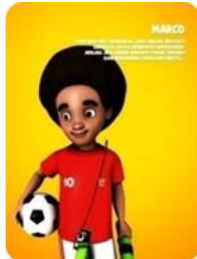
Gambar 5 Karakter Marco

dengan keahliannya tersebut. Kedua orang tua Marco berasal dari Ambon dan kebetulan sedang mencari nafkah di Desa Maju Makmur.