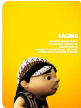
Gambar 6 Karakter Bagong

Bagong adalah representasi anak kampung yang divisualisasikan secara harfiah, mengenakan blangkon, surjan, dan ikon-ikon budaya (Jawa) membuatnya menjadi unik di antara kawan-kawannya yang lain. Secara umum, sifatnya kocak, lucu, lugu, sok tahu dan di setiap penampilannya selalu menghibur. Badannya yang tambun dan gaya bahasanya yang lucu membuat dia disukai kawan-kawannya. Bahkan ketika menjadi objek lelucon, Bagong tetap "tabah", dan tetap mengundang orang untuk tertawa. Satu hal yang menjadi kelemahan Bagong adalah sifatnya yang penakut, terutama untuk hal-hal yang berbau takhayul.