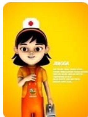
Gambar 8 Karakter Jingga

Jingga adalah karakter anak perempuan yang ceria dan cenderung sangat cerewet. Dia berasal dari keluarga yang cukup terpandang dan kaya di desa Maju Makmur (dipertimbangkan bapaknya adalah dokter atau mantri desa). Dia disukai teman-temannya karena sering membawakan oleh-oleh setiap kali dia dan keluarganya pergi ke kota atau selepas berlibur. Namun, dia sering digoda karena kebiasannya yang sangat "higienis" dan cerewet soal kebersihan dan kesehatan. Jingga memiliki kegemaran mengoleksi barang-barang berwarna oranye, bahkan baju sehari-hari yang dikenakannya juga hampir semuanya berwarna oranye atau tone warna tersebut. Jingga sering kali menjadi sasaran yang digoda Bagong.