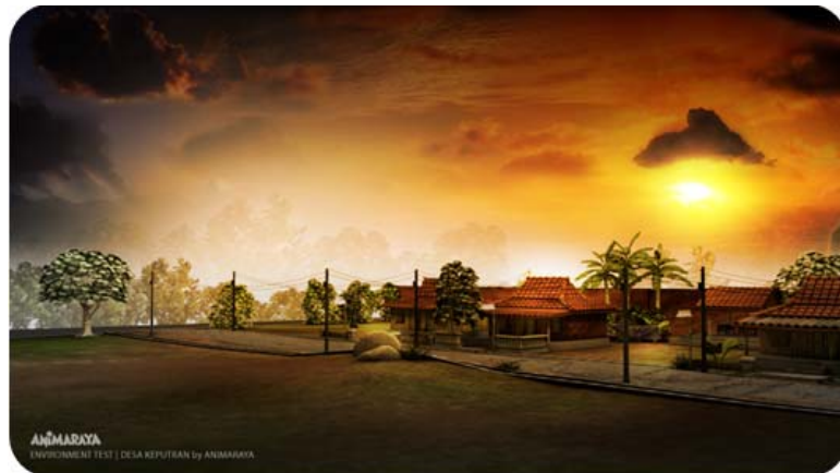
Gambar 12 Setting Pemukiman (Fajar)