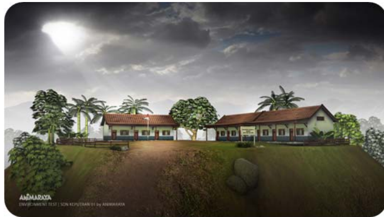
Gambar 11 Setting Sekolah

Setting setelah dikonversi menjadi objek 3D: