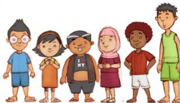
Gambar 2 Character Design/Comparison

Berikut adalah contoh desain karakter yang masih berupa sketsa: