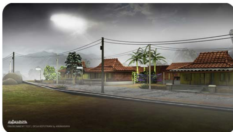
Gambar 13 Setting Pemukiman (Sore)