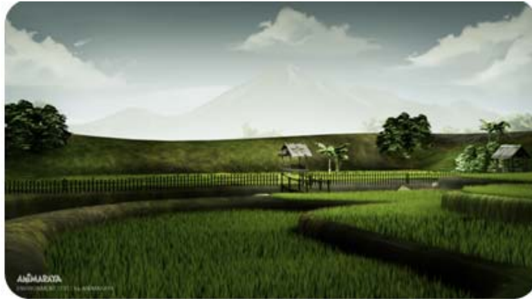
Gambar 14 Setting Persawahan