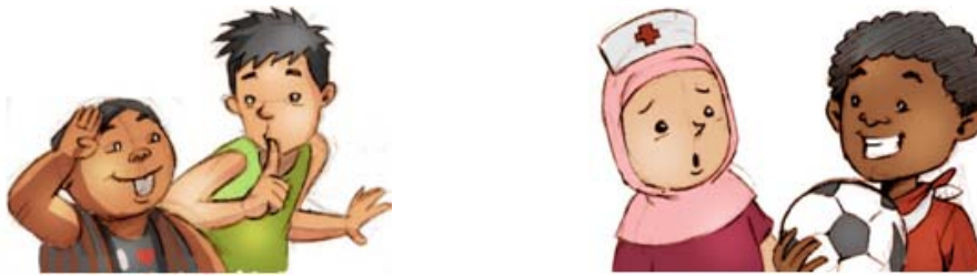
Gambar 3 Gesture/Expression

Dalam konteks pekerjaan desain karakter, juga meliputi penjelasan yang detail mengenai sifat, sikap, hobby dan sebagainya yang mendukung personifikasi karakter. Berikut adalah penjelasan masing-masing karakter berikut hasil visualisasi karakter setelah di- model :