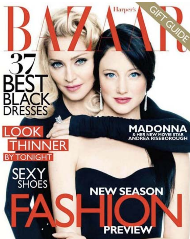
Gambar 5 Majalah dengan Penawaran Menarik dalam Cover Lines