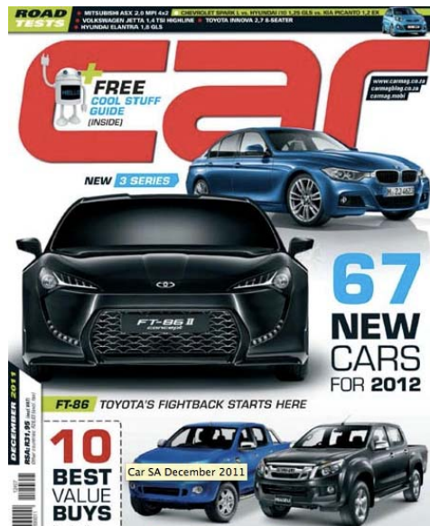
Gambar 4 Cover Majalah dengan Identifikasi Produk

Jelasnya identifikasi produk. Ketika merancang desain sampul majalah, pusat perhatian terletak pada imej foto/ilustrasi model/produk yang akan dijual. Dalam sekilas pandang, konsumen dapat langsung menangkap jenis majalah yang kita usung, produk utama yang ingin dijagokan dalam promosi edisi kali ini.