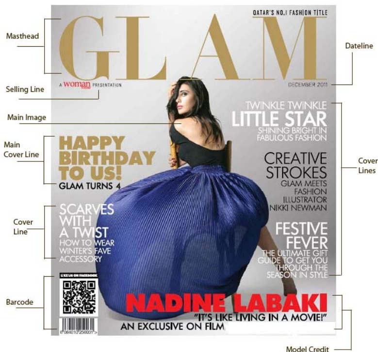
Gambar 1 Anatomi Sampul Sebuah Majalah

Sebelum kita mengenal sebuah sampul majalah desain yang baik, ada baiknya kita memahami anatomi dari desain sampul majalah. Gambar 1 adalah anatomi sampul sebuah majalah.