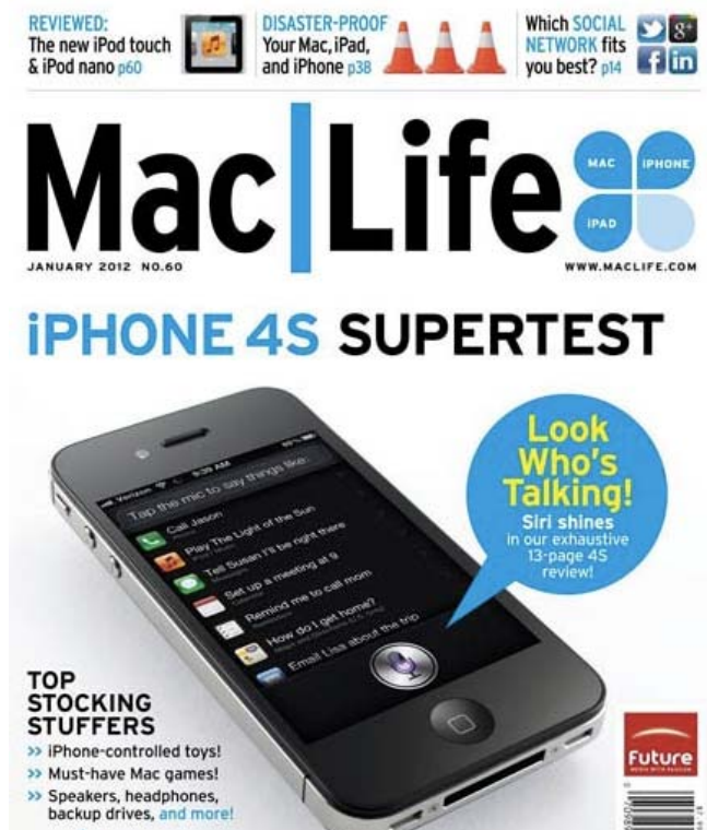
Gambar 6 Cover Majalah dengan Presentasi Produk