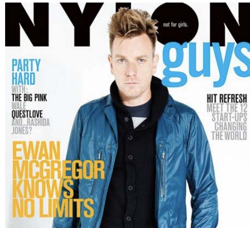
Gambar 3 Cover Majalah dengan Judul Artikel

Mengungkapkan cerita. Setiap pembaca harus dapat melihat judul menarik dari kisah cerita yang ingin dijual pada edisi tersebut. Menekankan judul kisah utama dan judul-judul artikel menarik lainnya akan menambah daya tarik sebuah majalah.