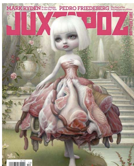
Gambar 2 Contoh Cover Majalah yang Menarik Perhatian

Menarik perhatian. Majalah biasa didistribusikan di took buku, supermarket, lapak majalah atau bahkan loyer koran & majalah. Desain sampul majalah harus dapat merebut perhatian pada pandangan pertama dengan penataan cover line yang terbaca jelas, kontras yang baik, dipadukan dengan imej foto/ilustrasi yang baik sehingga terbaca dari kejauhan.