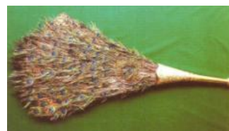
Gambar 20 Detail Elar Badak