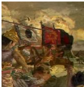
Gambar 29 Detail lukisan bendera perwira Mataram

Dalam penggambaran detail perwira Mataram, selain busana dan kuda, simbol lain yang tak luput dari perhatian Sudjojono adalah penggambaran lambang-lambang pasukan (korps) yang tidak dilakukan dengan asal, melainkan sudah distudi terlebih dahulu melalui sketsanya (Gambar 5). Dalam sketsa tersebut, Sudjojono menggambarkan secara detail bendera, lambang, nama-nama korps bahkan pemimpin dari korps tersebut. Seperti yang terlihat pada salah satu bendera yang dibawa oleh perwira Mataram, berwarna hitam dengan lambang menyerupai bintang berwarna merah pada bagian tengah (Gambar 29), bendera ini merupakan standar Tjokrogoro, korps Patang Poeloeh (Gambar 30).