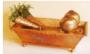
Gambar 14 Detail Cepuri