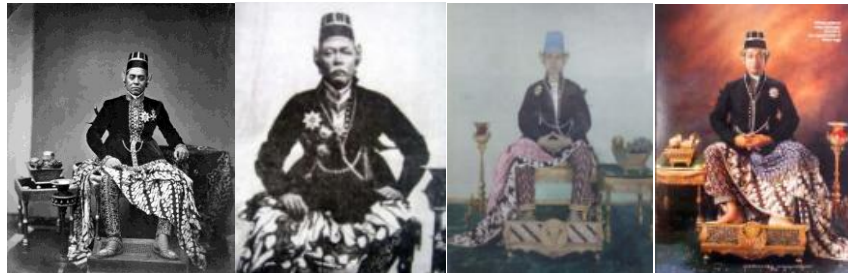
Gambar 7 Berbagai Potret Kenegaraan Sultan Hamengkubuwono (kiri ke kanan: Sultan Hamengkubuwono VI, Sultan Hamengkubuwono VII, Sultan Hamengkubuwono IX, dan Sultan Hamengkubuwono X)

terhormat adalah raja atau sultan sebagai Wong Agung , sehingga hanya raja di Keraton Yogyakarta yang berhak dan boleh duduk di atas singgasana yang bernama Dhampar Kencana . Strata sosial kedua adalah para bangsawan, para priyayi, tamu raja, kaum terpelajar (priyayi pikiran), para pejabat kolonial atau para petinggi yang masuk dalam kelompok Wong Gedhe yang boleh duduk diatas kursi. Strata sosial terakhir adalah kelompok abdi dalem yang tergolong sebagai kawula atau Wong Cilik , berada di strata paling bawah oleh karena itu kelompok ini tidak diperkenankan duduk diatas kursi, biasanya mereka menggunakan tikar, lantai atau tanah ataupun paling tinggi dingklik sebagai sarana duduk (Marizar, 2013). Berdasarkan stratifikasi ini, sangat jelas terlihat penggambaran Sultan Agung sebagai Wong Agung , duduk di singgasananya, sedangkan pelayan dan figur-figur lainnya sebagai Wong Cilik duduk bersimpuh di lantai ataupun tikar mengelilingi Sultan Agung.