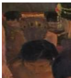
Gambar 19 Detail perempuan membawa Elar Badak