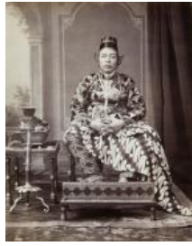
Gambar 27. Detail lukisan tentara Mataram dengan pakaian adat Bali