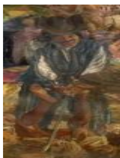
Gambar 24 Detail lukisan orang Jepang dalam pasukan JP Coen

Dilihat dari gaya busana dan penampilan terlihat perbedaan busana antara pasukan Mataram dan Belanda. Bila dicermati lebih teliti ada beberapa figur yang menggunakan gaya busana Eropa, namun memiliki rupa fisik Asia (Gambar 24). Dalam studinya di Belanda, Sudjojono menemukan bahwa tentara JP Coen tidak hanya terdiri dari orang-orang Belanda tetapi setidaknya terdapat 300 orang Jepang. Maka untuk menekankan fakta historis ini, Sudjojono menggambarkan beberapa figur berwajah Asia dalam tentara VOC. Apabila pasukan Belanda terdiri dari beberapa orang Jepang, lain halnya dengan pasukan Mataram. Pada masa itu Kerajaan Mataram yang berpusat di Yogyakarta merupakan kerajaan Islam yang disegani banyak kerajaan lain di nusantara. Sejumlah kerajaan di Pulau Jawa, serta nusantara bagian Timur seperti Madura, Bali, Nusa Tenggara Barat (NTB) hingga Makassar di Sulawesi Selatan merupakan wilayah kekuasaan Mataram. Sehingga sangat wajar bila pasukan Mataram yang diberangkatkan ke Batavia dalam jumlah sangat besar direkrut dari kerajaan-kerajaan yang menjadi bawahannya. Fakta historis ini dimengerti benar oleh Sudjojono, sehingga figur-figur pasukan Mataram digambarkan menggunakan busana dan membawa senjata dari berbagai daerah, salah satu contoh yang terlihat jelas adalah tentara Mataram yang menggunakan pakaian dan ikat kepala khas Bali (Gambar 25).