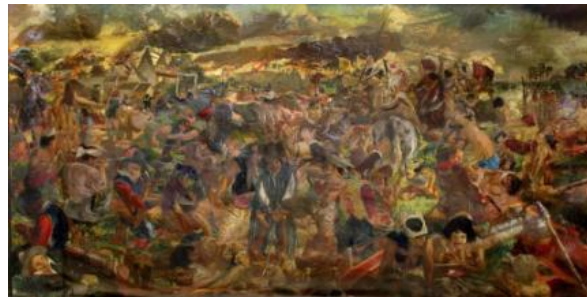
Gambar 21 Pertempuran pasukan Mataram dan tentara Belanda

Banyak sekali detail dan simbol-simbol yang digambarkan oleh Sudjojono dalam adegan pertempuran antara tentara Mataram dan pasukan Belanda. Walaupun menggambarkan suasana pertempuran, sama sekali tidak ada darah digambarkan dalam adegan ini. Hal ini sesuai dengan pesan yang ingin disampaikan oleh Sudjojono (1980) bahwa dendam bukanlah kasih yang baik dan Sudjojono tidak ingin melukiskan sesuatu yang penuh dengan dengan dan amarah, menurutnya “berembug 100 kali lebih baik daripada membunuh satu kali. Tidak ada untungnya orang membunuh orang lain, apa itu terjadi dalam perkelahian biasa atau dalam perang (1980:2).” Walaupun begitu, pertempuran tetap digambarkan dengan sangat dramatis. Beberapa hal yang akan dibahas dalam panel kedua adalah lokasi pertempuran, figur-figur tentara Belanda, dan figur-figur pasukan Mataram.