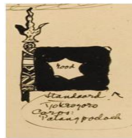
Gambar 30 Detail sketsa makna-makna bendera