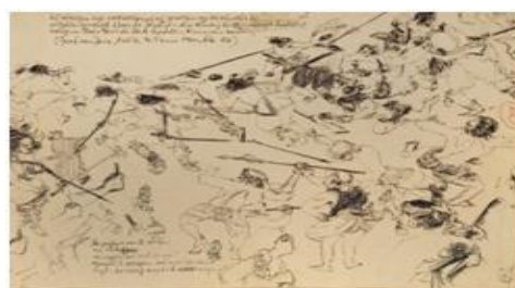
Gambar 3 Sketsa tentara Belanda lari tunggang langgang dikejar oleh orang Jawa 23 x 32,5 Cm. 1973. Ink on Paper .

Tanggal 9 Agustus 1973 kanvas mulai dipasang dan keesokan harinya semuanya sudah siap untuk dimulai. Namun atas rekomendasi Sergio Dello Strolago dari UNDP/DKI Jakarta yang ikut terlibat dalam Pemugaran Jakarta Kota, pada 27 Agustus 1973 sampai dengan 2 September 1973,