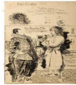
Gambar 32 Sketsa Pertemuan JP Coen dan Kyai Rangga

Lokasi pertemuan antara JP Coen dan Kyai Rangga digambarkan berlatar belakang kapal, sehingga terlihat seperti pelabuhan. Akan tetapi, lokasi pertemuan belum dapat dipastikan karena belum ada data yang akurat dan biasanya pertemuan dengan seorang Gubernur Jendral dilakukan secara formal di dalam ruangan tertutup, bukan di pelabuhan terbuka seperti yang digambarkan oleh Sudjojono. Pada saat mengajukan tawaran damai, Kyai Rangga tentu saja membawa hadiah untuk Belanda berupa 6 ikat gabah (Gambar 33). Menurut fakta historis Belanda pada saat itu sedang kesulitan beras karena Sultan Agung melarang petinggi kerajaan untuk menjual beras kepada Belanda.