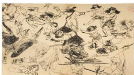
Gambar 2 Sketsa Adegan Perkelahian. 22,5 x 32,6 cm. 1973. Ink on Paper

Sekembalinya ke Indonesia pada Juni 1973, dari seluruh informasi dan data yang telah dikumpulkan, Sudjojono mulai mengerjakan lebih dari 40 buah sketsa. Persiapan lain yang dilakukan adalah membuat sanggar sebesar 13 x 8 m di Pasar Minggu. Kanvas tiba dari Belanda di Sanggar Pandanwangi, Pasar Minggu, pada 17 Juli 1973 yang pengirimannya dimudahkan dengan bantuan UNDP (United Nations Development Project). Kesulitan berikutnya yang ditemui Sudjojono adalah membenteng kanvas sebesar 10 x 3 m dan seberat terpal truk. Dalam tulisannya Sudjojono mengatakan “ ..untuk kanvas yang begitu beratnya dibutuhkan spanraam yang terdiri dari 6 batang balok jati yang kering benar dan panjang masing-masing 5 meter. Balok-balok tersebut lebih besar dari tiang-tiang sanggar saya (12 x 13 cm). Dan untuk membentangkan dan menarik kanvas sebesar 2,5 kali bak truk 10 ton itu dibutuhkan teknik tertentu, belon lagi kesulitan menempelkannya ke tembok sanggar saya kalau kanvas-kanvas tadi sudah terbenteng. ” (1980:6)