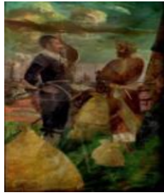
Gambar 31 Pertemuan antara JP Coen dan Kyai Rangga sebagai utusan Sultan Agung