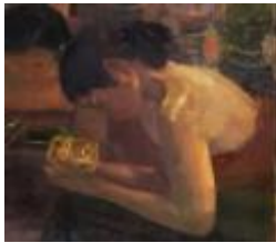
Gambar 13 Detail perempuan membawa Cepuri (tempat sirih)

depan (Gambar 15 dan Gambar 16), kemungkinan ada juga Wadhah Ses (tempat rokok) tetapi tidak terlihat, ketiga regalia tersebut memberikan makna proses pembuatan keputusan/kebijakan negara. Selain itu juga terlihat regalia atau pusaka lain yaitu Sawung (Ayam Jantan) yang melambangkan kejantanan dan tanggung jawab dibawa oleh perempuan di deretan belakang di sebelah kiri Sultan Agung, namun hanya terlihat ekor ayamnya (Gambar 17 dan Gambar 18). Selain regalia ada juga yang disebut dengan Seperangkat Ampilan atau Ampilan Dalem , salah satu perangkat Ampilan Dalem yang terlihat adalah Elar Badak atau kipas yang terbuat dari bulu burung merak di sebelah kanan Sultan Agung (Gambar 19 dan Gambar 20).