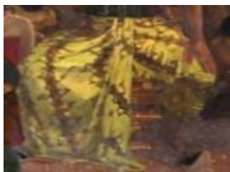
Gambar 9 Detail lukisan batik yang digunakan oleh Sultan Agung

Memiliki makna penuh keagungan dan kesaktian. Marizar (2013) mengatakan menurut tradisi keraton, Parang Barong merupakan motif suci yang digunakan sesuai peraturan adat dan upacara resmi di lingkungan Keraton. Motif hias ini dipilih untuk menghadirkan suatu karakter atau kepribadian penguasa kerajaan dan simbol kekuasaan raja. Batik ini dikenal dengan batik klasik/pakem yang berkembang di lingkungan istana dan banyak dipakai untuk kepentingan adat (Astuti, 2012). Motif ini diciptakan hanya untuk digunakan oleh para raja keturunan Mataram sejak Sultan Agung dan sampai saat ini masih digunakan oleh raja-raja Kesultanan Yogyakarta.