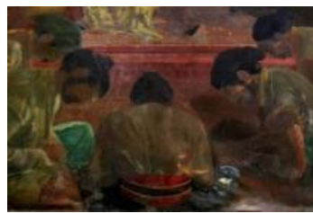
Gambar 12 Detail lukisan pejabat tinggi Sultan Agung

Selain para bangsawan, di sekeliling Sultan Agung juga digambarkan 30–40 perempuan yang membawa berbagai benda pusaka sebagai simbol pemegang kekuasaan yang disebut dengan regalia yang dibawa oleh gadis perawan yang disebut dengan Abdi dalem Manggung . Regalia merupakan perlambangan dari sifat yang harus dimiliki oleh seorang sultan, terdiri dari: Angsa, Rusa, Ayam Jantan, Burung Merak, Raja Naga, kotak Penyimpanan Uang, Kotak Sapu tangan, Lampu Minyak serta Tempat Sirih, tempat rokok dan tempat meludah dan semuanya terbuat dari emas. Tidak terlihat jelas apakah Sudjojono menggambar semua regalia, atau hanya beberapa saja. Regalia yang terlihat dalam lukisan adalah Cepuri (tempat sirih) di sebelah kanan Sultan Agung (Gambar 13 dan Gambar 14), Kecohan (tempat meludah) di sebelah kiri Sultan Agung dibawa oleh perempuan kedua dari