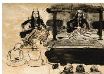
Gambar 6 Sketsa Gaya posisi duduk Sultan Agung 26 x 34,5 cm. 1973. Ink on Paper .

Posisi duduk Sultan Agung digambarkan serupa dengan posisi duduk Sultan pada berbagai potret kenegaraan Sultan Hamengkubuwono (Gambar 7), hanya posisi tangannya saja yang berbeda. Sultan Hamengkubuwono IX dan X dengan posisi tangan ditelungkup di bagian tengah, sedangkan Sultan Hamengkubuwono VI, posisi salah satu tangan diletakkan di bagian pangkal kaki dan tangan lainnya bersandar pada meja, dan Sultan Hamengkubuwono VII dengan kedua tangan diletakkan di bagian pangkal kaki. Sultan Agung sendiri digambarkan dengan posisi tangan serupa dengan Sultan Hamengkubuwono VI yaitu satu tangan diletakkan pada bagian pangkal kaki dan tangan lainnya bersandar pada lutut. Mengacu pada posisi duduk atau kursi dalam stratifikasi sosial dan etika Jawa ada 3 macam posisi duduk. Yang pertama strata sosial yang paling agung, paling tinggi dan sangat