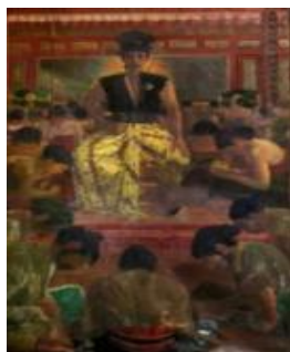
Gambar 4 Panel 1: Sultan Agung sedang memimpin Rapat Kerja

mengenai komposisi lukisan pada panel 1 (Gambar 4), " Sultan Agung sedang duduk di singgasananya dengan para bangsawannya yang duduk di hadapannya. Sudjojono menggambarkan teknik komposisi 'iconic', dengan komposisi subjek terpenting diletakan di tengah. Komposisi tersebut menampilkan kesan powerful " (2013:37). Hal ini sesuai dengan saran dari Strologo (1973) untuk melukiskan seorang sultan Jawa yang memiliki kekuasaan mutlak terhadap rakyatnya, belum lagi penggambaran figur-figur bangsawan dan pelayan di sekitar Sultan Agung yang menundukkan kepala seakan-akan sedang menghaturkan segala hormatnya, menambah kuat kesan kekuasaan mutlak yang dimiliki Sultan Agung.