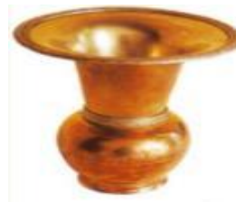
Gambar 16. Detail Kecohan