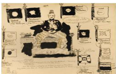
Gambar 5 Sketsa Beginilah cara duduk Sultan Agung 26,2 x 34,7 cm. 1973. Ink on Paper

Untuk melukiskan posisi duduk Sultan Agung dalam Upacara Seban atau rapat kerja, Sudjojono melakukan berbagai studi sketsa (Gambar 5 dan Gambar 6). Karena data mengenai Kerajaan Mataram sulit didapatkan, dalam menggambarkan kemegahan Keraton Jawa, Sudjojono banyak mengacu pada Keraton Yogyakarta yang merupakan pecahan dari Kerajaan Mataram (pecahan lainnya adalah Keraton Solo) yang dipecah oleh Belanda melalui perjanjian Giyanti 1755. Dipercaya bahwa etika dan protokoler keraton yang masih berlangsung di Keraton Yogyakarta hingga saat ini merupakan warisan dari Kerajaan Mataram Islam.