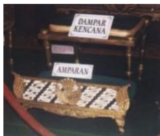
Gambar 8 Dhampar Kencana versi ke-4, diciptakan dan didesain oleh Sultan Hamengkubuwono VIII

Selain posisi duduk, kursi atau singgasana Sultan Agung yang digambarkan Sudjojono juga mengacu pada singgasana Sultan Hamengkubuwono. Disebut Dhampar Kencana dengan alas kakinya yang disebut amparan (gambar 8). Marizar (2013) menjelaskan Dhampar Kencana adalah singgasana emas yang digunakan sebagai tempat duduk raja, berbentuk kursi tanpa sandarang punggung dan sandaran tangan atau dalam budaya Barat sering disebut dengan stool . Bentuk Dhampar Kencana diadopsi dari bentuk dhingklik (sarana duduk untuk Wong Cilik ) yang telah diperbesar. Demikian pula bentuk amparan yang dibuat dengan ukuran yang kecil diciptakan mirip dengan dhingklik . Hal ini memberikan makna bahwa takhta adalah untuk rakyat. Walaupun dalam lukisan Sudjojono, Sultan Agung tidak menggunakan amparan sebagai alas kaki, namun dapat dipastikan bahwa Sultan Agung duduk diatas sebuah singgasana serupa dengan Dhampar Kencana .