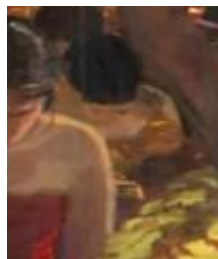
Gambar 17 Detail perempuan membawa Sawung (ayam jantan)