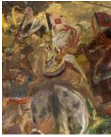
Gambar 26 Detail lukisan orang Jepang dalam pasukan JP Coen