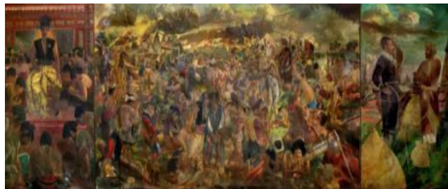
Gambar 1 Lukisan Pertempuran Antara Sultan Agung dan Jan Pieterszoon Coen, 3 x 10 m, 1974 (Sumber: S. Sudjojono Center, 2013)

Sebagai Bapak Seni Rupa Modern, S. Sudjojono telah menghasilkan ratusan karya seni dengan beragam tema mulai dari tema perjuangan, tema keluarga sampai ke permasalahan dan kritik sosial. Namun dari ratusan karya Sudjojono, ada satu karya yang memiliki nilai khusus, baik dari sisi perekaman sejarah, intelektualitas seni maupun segi ukuran, sayangnya karya ini banyak dilewatkan. Walaupun memiliki ukuran yang luar biasa besar 3 x 10 m, sebagian besar pengunjung Museum Sejarah Jakarta, tempat lukisan tersebut berada sejak tahun 1974, tidak tahu mengenai keberadaan lukisan tersebut. Dalam kurasinya, Saptari (2013:30). mengatakan: “Dilihat dari tema, kesulitan teknik, komposisi, ukuran dan waktu yang dibutuhkan baik untuk riset dan pengerjaan, karya ini merupakan salah satu karya terpenting yang pernah dihasilkan Sudjojono dalam perjalanan karir berkeseniannya.” Saptari menambahkan bahwa di dalam karya ini juga terkandung “..pesan-pesan penting yang tidak saja menggambarkan nasionalisme Sudjojono, namun juga memotivasi para penikmatnya untuk mencintai bangsa dan negaranya sebagai bangsa besar yang sederajat dengan bangsa-bangsa besar lainnya di dunia (ibid, 33). Oleh karena itu, lukisan (Gambar 1) ini dipilih menjadi salah satu highlight dalam pameran seabad Sudjojono yang diselenggarakan untuk memperingati 100 tahun lahirnya Sudjojono pada 13-22 Desember 2013 yang lalu di Jakarta.