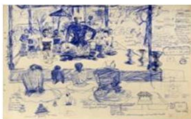
Gambar 11 Sketsa Sultan Agung dikelilingi pejabat tingginya. 29 x 43 cm. 1973. Ink on Paper

Melalui berbagai data, dipastikan bahwa Sultan Agung tidak terjun secara langsung ke medan pertempuran, sehingga Sudjojono memutuskan untuk menggambar figur Sultan Agung sedang melakukan Upacara Seban atau rapat kerja guna mengatur strategi perang. Suasana rapat beserta dengan figur-figur yang terlibat di studi melalui beberapa sketsa (Gambar 11). Uniknyanya dalam sketsa tersebut, Sudjojono juga menulis catatan kecil mengenai fakta-fakta historis yang terjadi, sehingga dari sketsa tersebut dapat diketahui bangsawan siapa saja yang digambarkan oleh Sudjojono. Salah satu di antaranya adalah Tumenggung Bhaureksa (Adipati Kendal) yang memimpin pasukan Mataram masuk ke Batavia dari arah Selatan. Bangsawan lainnya adalah Tjakraningrat, Dipati Ukur, dan Sura Agul-Agul. Mereka digambarkan sedang menundukkan kepala menunggu perintah Sultan Agung (Gambar 12).