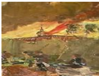
Gambar 22 Detail lukisan atap Gedung Balaikota yang terbakar

Tidak ada penjelasan lebih lanjut mengenai waktu pertempuran, apakah yang digambarkan oleh Sudjojono adalah serangan pertama (1628) atau serangan kedua (1629). Namun apabila diteliti dari sisi sejarah, disebutkan bahwa pada serangan kedua, tentara Mataram berhasil membakar gedung Stadhuis (balaikota) dan bila dilihat dengan saksama pada panel 2, suasana pertempuran dilatarbelakangi berbagai gedung yang terbakar dan salah satunya diyakini sebagai Gedung Balaikota (Gambar 22), yang saat ini menjadi lokasi Museum Sejarah Jakarta. Sudut pandang yang diambil oleh Sudjojono dari arah tenggara kota tua yang sekarang, sehingga bila dipelajari dari peta kota Batavia tahun 1627 (Gambar 23) memperkuat simpulan bahwa yang digambarkan oleh Sudjojono adalah peristiwa penyerangan yang kedua (1629). Perlu diingat bahwa pasukan Mataram tidak pernah berhasil menembus satupun benteng kota Batavia, sehingga pertempuran hanya terjadi di luar tembok kota seperti yang digambarkan oleh Sudjojono.