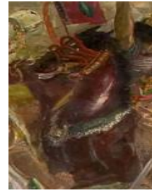
Gambar 28 Detail lukisan Kuda yang berasal dari Turki (Sumber: S. Sudjojono Center, 2013)

Dalam penggambaran detail perwira Mataram, selain busana dan kuda, simbol lain yang tak luput dari perhatian Sudjojono adalah penggambaran lambang-lambang pasukan (korps) yang tidak dilakukan dengan asal, melainkan sudah distudi terlebih dahulu melalui sketsanya (Gambar 5). Dalam sketsa tersebut, Sudjojono menggambarkan secara detail bendera, lambang, nama-nama korps bahkan pemimpin dari korps tersebut. Seperti yang terlihat pada salah satu bendera yang dibawa oleh perwira Mataram, berwarna hitam dengan lambang menyerupai bintang berwarna merah pada bagian tengah (Gambar 29), bendera ini merupakan standar Tjokrogoro, korps Patang Poeloeh (Gambar 30).