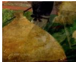
Gambar 33 Detail lukisan Gabahan sebagai tawaran damai

Lokasi pertemuan antara JP Coen dan Kyai Rangga digambarkan berlatar belakang kapal, sehingga terlihat seperti pelabuhan. Akan tetapi, lokasi pertemuan belum dapat dipastikan karena belum ada data yang akurat dan biasanya pertemuan dengan seorang Gubernur Jendral dilakukan secara formal di dalam ruangan tertutup, bukan di pelabuhan terbuka seperti yang digambarkan oleh Sudjojono. Pada saat mengajukan tawaran damai, Kyai Rangga tentu saja membawa hadiah untuk Belanda berupa 6 ikat gabah (Gambar 33). Menurut fakta historis Belanda pada saat itu sedang kesulitan beras karena Sultan Agung melarang petinggi kerajaan untuk menjual beras kepada Belanda.