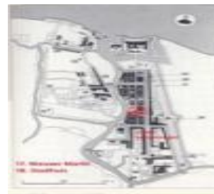
Gambar 23 Peta Batavia 1627