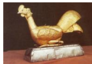
Gambar 18 Detail Sawung