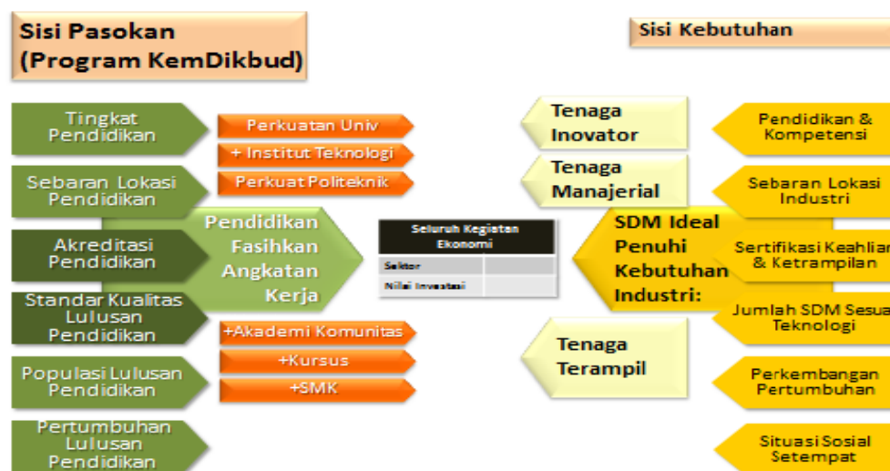
Gambar 1 Pendekatan Pemetaan Kebutuhan SDM

Pilihan mendirikan Akademi Komunitas tentu bukan satu-satunya aplikasi American Community College untuk Indonesia. Di sini nilai-nilai dari American Community College dapat diserap untuk kepentingan pengembangan Akademi Komunitas di Indonesia. Jika nilai-nilai tersebut ditempatkan dalam Akademi Komunitas Indonesia, para mahasiswa akan menjadi lebih baik dari yang sudah baik dan lebih benar dari yang sudah benar dalam hal Skill, Knowledge, and Attitude .