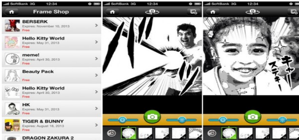
Gambar 4 Otaku Camera

(Sumber: http://vnfa8y5n3zndutm1.zippykid.netdna-cdn.com/wp-content/uploads/2013/06/mzl.lrrqbjeh.320x480-75-610x358.jpg )