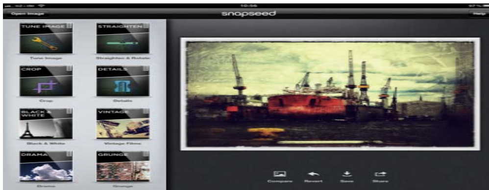
Gambar 5 Snapseed