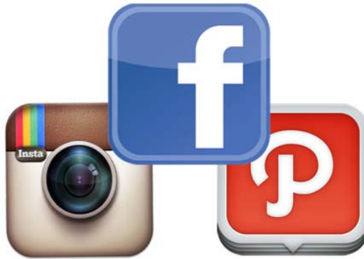
Gambar 3 Jenis media sosial yang saat ini banyak digunakan di masyarakat perkotaan, terutama di Indonesia (Ki: Instagram, Teng: Facebook, Ka: Path)

Raymond Williams berkata bahwa sebuah budaya yang menyenangkan dan banyak disukai oleh banyak orang itu berarti adalah budaya populer (Strinati, 2007). Dalam hal ini, aplikasi pengolah foto instan memang sebagai budaya populer yang disukai masyarakat. Masyarakat menyukai aplikasi pengolah foto instan karena masyarakat mengetahui bahwa dengan menggunakan produk tersebut, mereka dapat melakukan pengolahan foto mereka secara cepat dan mudah meskipun hasilnya mungkin tidak sebaik jika menggunakan software pengolah foto yang lebih serius. Mengutip Raymond Williams (Strinati, 2007) “budaya populer adalah budaya yang berselera rendah”, pengolah foto instan pada ponsel pintar memang tidak bertujuan untuk membuat foto penggunanya menjadi foto yang bisa digunakan untuk kebutuhan profesional atau kebutuhan yang lebih serius. Budaya berselera rendah menurut Williams memang cukup menggambarkan kondisi masyarakat kota saat ini dalam penggunaan media aplikasi pengolah foto instan yang populer. Akan tetapi, secara konten visual serta kebutuhannya memang masih belum cukup baik untuk kebutuhan tertentu.