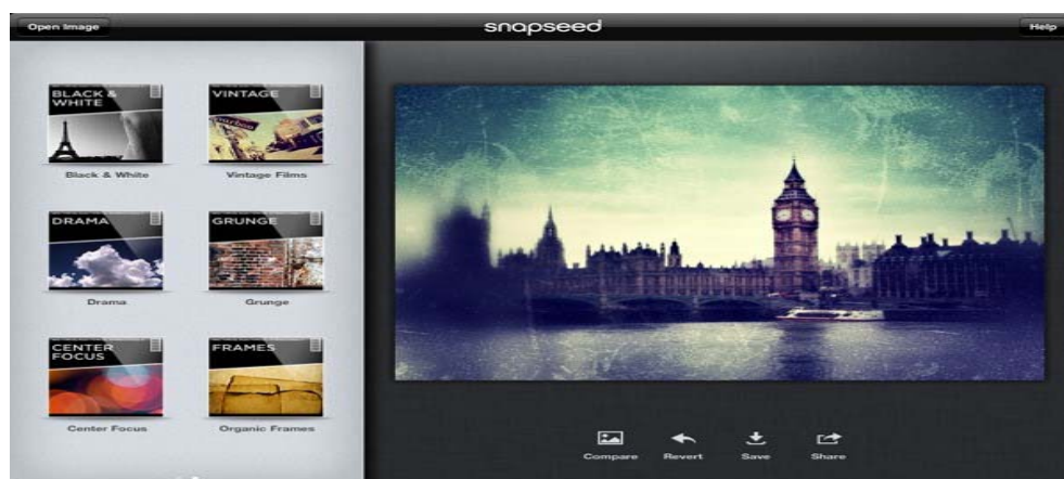
Gambar 1 Snapseed, salah satu aplikasi pengolah foto populer di smartphone dan tablet

Mengetahui fenomena tersebut, banyak pengembang aplikasi berlomba-lomba untuk membuat aplikasi pengolah foto yang sifatnya lebih cepat dan mudah, sehingga penggunaanya tidak perlu bersusah payah dalam menggunakannya. Akibatnya memang bisa ditebak, aplikasi pengolah foto pada ponsel pintar banyak digemari dan saat ini jumlahnya menjadi makin banyak dengan fasilitas yang beragam pula. Gambar 1 merupakan salah satu contoh aplikasi pengolah foto di smartphone dan tablet .