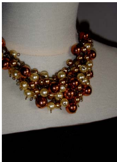
Gambar 7 Contoh foto dari kamera pocket yang belum diedit brightness dan contrast -nya

Gambar 7 dan 8 adalah contoh foto dengan pencahayaan sederhana, dengan menggunakan matahari dipagi hari, sekitar pukul 10.00 WIB. Setelah memfokuskan foto hanya pada bagian barang yang akan kita jual, maka kita dapat langsung mengeditnya seperti bahasan di atas.