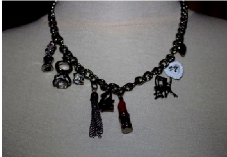
Gambar 1 Menggunakan gambar yang gelap