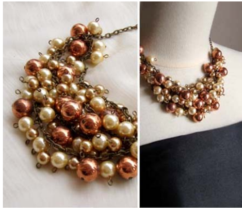
Gambar 9 Contoh layout foto yang menggunakan kotak dan garis

bidang yang berbeda dari barang yang akan dijual. Gunakan warna sederhana seperti warna hitam atau putih saja, agar garis dan box berkesan minimalis dan netral.