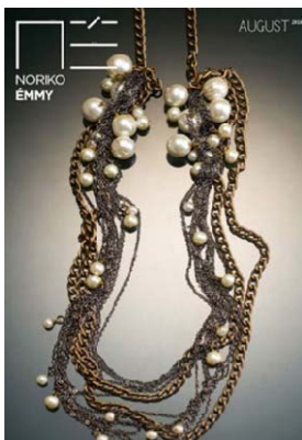
Gambar 4 Memberikan gambaran detail dari barang dengan menggunakan pencahayaan yang baik