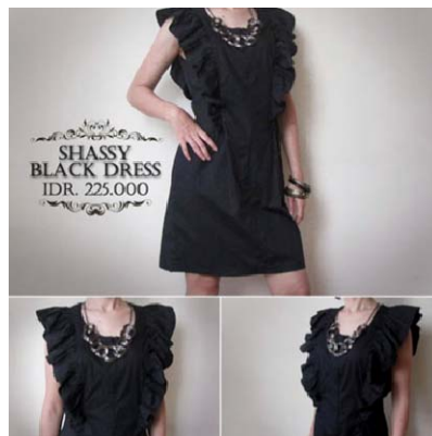
Gambar 5 Memberi elemen garis yang seimbang untuk menunjukkan detail dari berbagai sudut