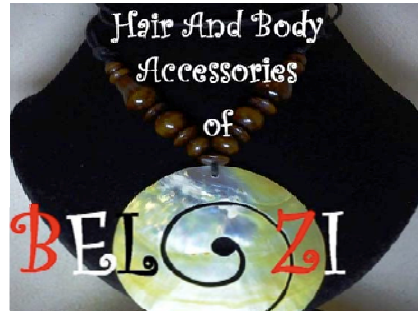
Gambar 2 Penggunaan font terlalu besar dan ramai yang sangat mengganggu