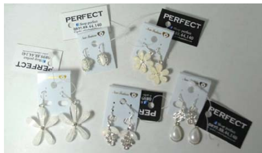
Gambar 3 Tidak adanya penekanan elemen desain sehingga tidak indah dipandang