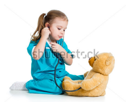
Gambar 18