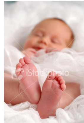
Gambar 11

Sebaiknya fotografer meletakkan kamera sejajar dengan posisi mata bayi atau anak jika menginginkan tubuh mereka tampak proporsional (kepala tidak lebih besar daripada bagian tubuh yang lain), posisi fotografer jongkok atau berbaring sejajar dengan badan model. Secara alami tubuh bayi dan anak masih jauh lebih pendek daripada fotografer, kecuali jika fotografer menginginkan efek dan angle tertentu.