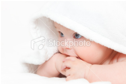
Gambar 14

Bayi dan anak kecil pada dasarnya adalah polos dan lugu. Sorot mata dan mimik serta tingkah laku mereka juga pada dasarnya jujur dan spontan. Sehingga, penampilan mereka dalam sebuah foto pada umumnya ditampilkan dengan situasi dan kondisi yang terang, lembut, ceria dalam kombinasi warna warna yang menyenangkan. Karakter yang ditampilkan juga didukung dengan pencahayaan yang lembut dengan daerah terang yang mayoritas daripada bayangan.