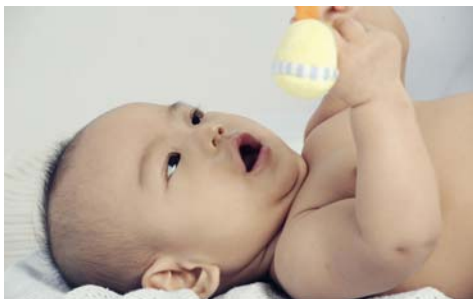
Gambar 6

Yang paling penting dari semua bagian pemotretan bayi dan anak kecil adalah ekspresi dan mimik yang muncul sebagai emosi diungkapkan oleh anak. Baik itu senyum malu-malu, maupun tangisan sedih, ungkapan kekesalan atau kegemasan, semuanya itu akan menjadi momen yang berharga untuk diabadikan dalam pemotretan bayi dan anak kecil. Proses sosialisasi mereka dengan sesama anak kecil lain, atau saat mereka memandang orangtuanya atau kakek neneknya, itu semua pasti memiliki keunikan dan sisi menarik sendiri yang hanya bisa didapatkan dengan kesabaran menanti momen oleh si fotografer. Berlaku pula hal yang sama seandainya fotografer adalah orangtua atau keluarga si model, menanti momen saat anak berekspresi tetap harus diutamakan.