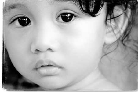
Gambar 13