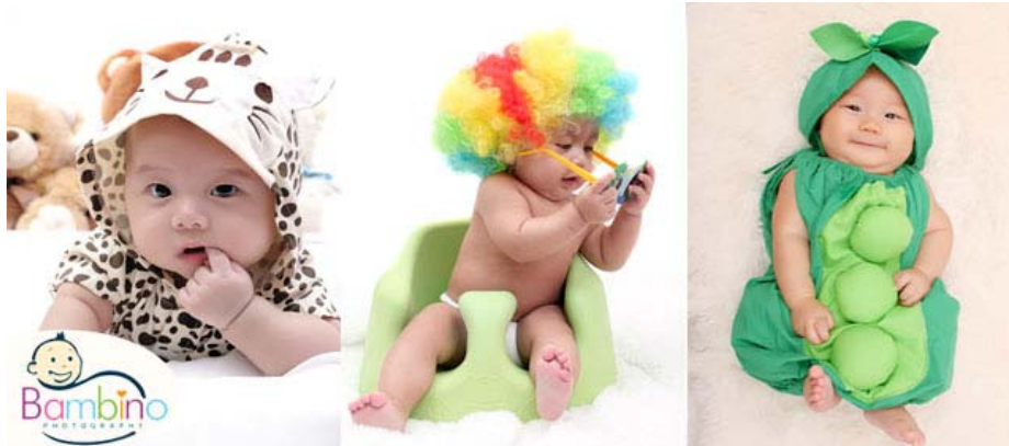
Gambar 3

Untuk bayi yang masih sangat kecil, yang indera penglihatan dan pendengarannya belum maksimal, ada juga keuntungan untuk si fotografer sehingga bisa mengatur tema dan properti lebih leluasa, karena bayi-bayi itu hanya bisa pasrah diatur gaya oleh orang tua atau fotografer, terlebih lagi apabila mereka dalam keadaan tidur atau dalam keadaan tenang. Apabila properti yang sama dipakaikan ke bayi yang sudah bisa bergerak dan lebih aktif, properti tersebut kemungkinan tidak bisa dipakaikan karena mereka sudah memiliki gerakan yang lebih lincah (gambar 3)