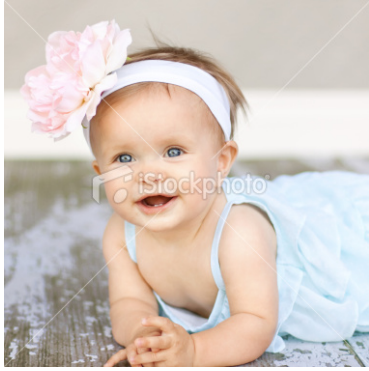
Gambar 12