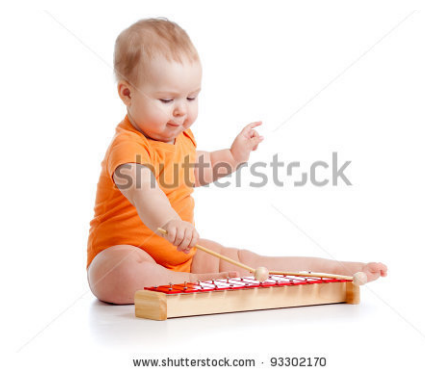
Gambar 23