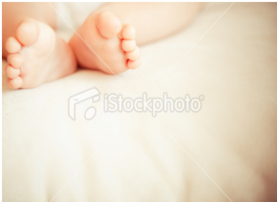
Gambar 10

Saran yang sama dalam pemotretan untuk model orang dewasa adalah mata merupakan bagian yang terindah dalam memotret anak dan bayi. Sebaiknya lebih memfokuskan bagian mata anak bila fotografer mengambil sudut pemotretan yang sejajar dengan muka anak. Bisa juga dengan menerapkan selective focus , fotografer memotret bagian detail tangannya saja, atau tangan berikutan mainan atau makanan yang dipegang anak, menggunakan tehnik depth of field pendek.