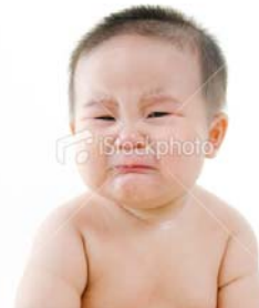
Gambar 7