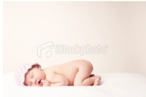
Gambar 15

Oleh sebab itu akan lebih mudah bagi seorang fotografer untuk memotret dengan situasi pencahayaan yang merata. Misalnya bila harus memotret di rumah anak, lebih baik si fotografer memposisikan bayi atau anak tersebut di bagian rumah yang tidak terkena langsung cahaya matahari, misalnya dengan memilih sudut teras rumah yang tertutup atap dibanding di halaman yang tidak tertutup atap. Bila lokasi pemotretan berada di luar rumah, lebih baik mencari tempat yang teduh misalnya dibawah pohon atau di sudut yang tidak terkena langsung cahaya matahari misalnya yang terhalang gedung tinggi.