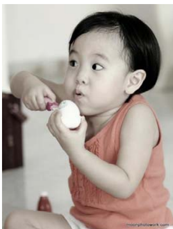
Gambar 4

Biasanya dibandingkan dengan sibuk mengarahkan seorang anak kecil atau bayi untuk mengikuti apa yang fotografer inginkan, akan lebih bijak bila fotografer hanya mengatur lingkungan atau latar belakang lokasi pemotretan sesuai tema yang sudah dirancang. Namun tetap membiarkan si model bebas dan asyik melakukan kegiatannya sendiri. Mereka akan lebih nyaman dan lebih tampak natural saat mengunyah biskuit kesukaan mereka, atau mereka lebih sibuk menggigit teether atau mainan mereka saat giginya mulai tumbuh. Mereka akan cukup 'asyik dan sibuk' dengan kegiatan itu saat si fotografer memotret dan merekam kegiatan itu. Dibandingkan bila anak atau bayi itu diarahkan untuk bergaya atau diatur seperti 'ide' si fotografer, mereka mungkin tidak nyaman dan merasa terganggu sehingga mereka rewel atau protes dengan cara menangis. Walaupun demikian, momen menangis juga bisa menjadi momen yang baik juga untuk direkam.