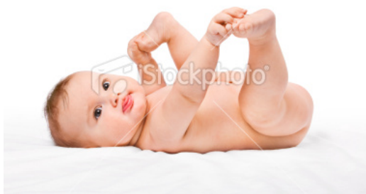
Gambar 1

Dengan kesabaran dan keuletan seorang fotografer, makin banyak foto yang mungkin akan direkam dibandingkan dengan fotografer yang lebih berkarakter 'mencari' angle dari aktifitas seorang anak kecil atau balita. Misalnya daripada berusaha keras mencari sudut pemotretan untuk seorang anak agar bisa merekam gambar yang bagus, seorang fotografer akan lebih baik mencari sambil menunggu momen dari ekspresi natural anak tersebut. Sebab memotret anak kecil tidak bisa diarahkan atau diberi instruksi seperti memotret orang dewasa, anak kecil terutama bayi, akan melakukan apa yang mereka ingin lakukan, mereka akan tertawa semau mereka bahkan bisa menangis dan bermain semau mereka. Mereka bisa merajuk bila terlalu lelah atau mengalami kebosanan, bayi bisa menangis bila merasa bosan atau saat popoknya sudah kotor..atau sekedar menangis karena lapar. Sehingga makin peka menunggu momen akan semakin memungkinkan fotografer untuk mendapatkan gambar yang bagus beserta ekspresi yang bagus pula, seperti contoh di gambar 1 dan 2 dibawah, yang menampilkan ekspresi lugas dari seorang bayi dan anak kecil.