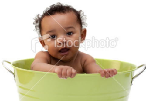
Gambar 22

Ada baiknya menggunakan Mode Continue/ Burst (atau Mode Scene: Sports ) karena anak-anak cenderung banyak bergerak, dan kemungkinan si fotografer kewalahan kalau memaksakan kamera mencari fokus di mode Single . Sehingga ada baiknya menggunakan mode continue/burst atau menggunakan settingan otomatis di scene sports/children . Sehingga tidak fotografer tidak sampai menyesal karena kehilangan beberapa momen yang menarik yang bisa jadi tidak dapat diulang kembali untuk direkam dalam karya foto.