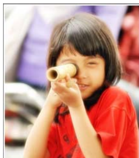
Gambar 8

Latar belakang ( Background ) dan latar depan ( Foreground ) saat pemotretan bayi dan anak kecil juga cukup membantu fotografer dalam menghasilkan foto yang menarik, disamping properti pendukung yang bisa diatur sesuai tema. Namun sebaiknya, pemotretan dihindarkan dari latar yang terlalu ramai atau berantakan karena objek utama, yaitu anak-anak, bisa menjadi berkurang keberadaannya. Bila seandainya situasi tersebut tidak dapat dihindari, maka pemilihan lensa dengan bukaan diafragma yang paling lebar untuk menghasilkan ruang tajam atau depth of field yang pendek untuk membuat latar tadi tampak blur sangatlah bermanfaat. Sehingga fokus pengamat pada frame foto masih terdominasi pada anak.