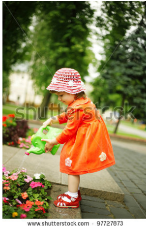
Gambar 20