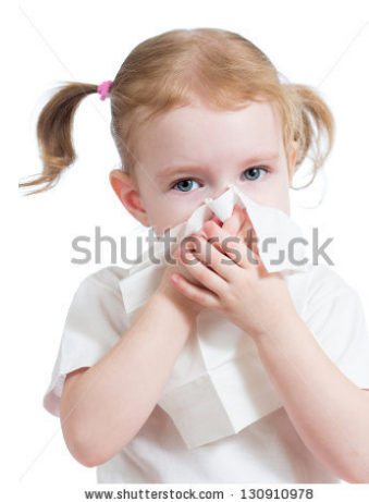
Gambar 21

Ada baiknya menggunakan Mode Continue/ Burst (atau Mode Scene: Sports ) karena anak-anak cenderung banyak bergerak, dan kemungkinan si fotografer kewalahan kalau memaksakan kamera mencari fokus di mode Single . Sehingga ada baiknya menggunakan mode continue/burst atau menggunakan settingan otomatis di scene sports/children . Sehingga tidak fotografer tidak sampai menyesal karena kehilangan beberapa momen yang menarik yang bisa jadi tidak dapat diulang kembali untuk direkam dalam karya foto.