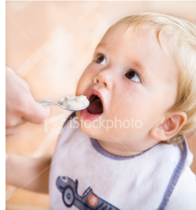
Gambar 17