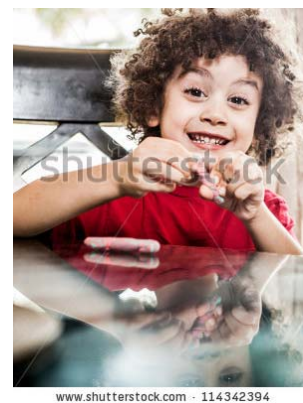
Gambar 2

Untuk memotret anak yang sudah bisa diajak bermain dalam beberapa situasi memang lebih menguntungkan bagi fotografer. Mereka bisa dialihkan dengan benda, bisa berupa mainan atau mungkin makanan untuk menarik perhatian mereka. Sehingga, disaat mereka mengeksplorasi benda itu, fotografer bisa merekam berbagai gestur atau ekspresi kesibukan dan keasyikan si anak. Apabila bayi model foto tersebut sudah bisa mendengar panggilan atau sudah bisa bereaksi dengan benda dan mengikuti suara, fotografer bisa mengarahkan mata atau wajah si bayi kearah bunyi-bunyian atau benda yang menarik perhatian mereka dan merekam momen tersebut (Child & Galer, 2008).