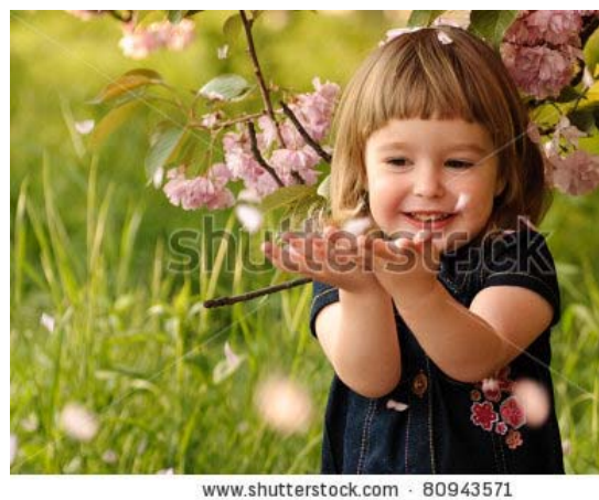
Gambar 5