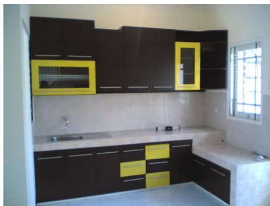
Gambar 8 Prinsip Ergonomi Diterapkan pada Dapur Minimal