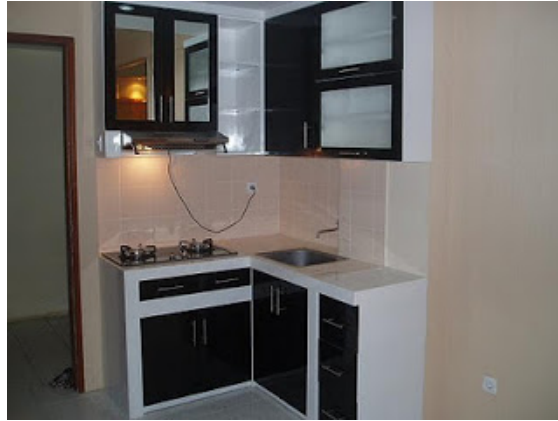
Gambar 6 Dapur Minimalis bentuk L