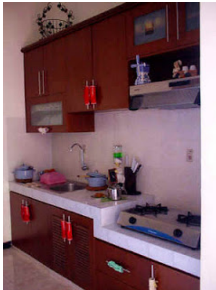
Gambar 7 Dapur Minimalis bentuk In-Line.