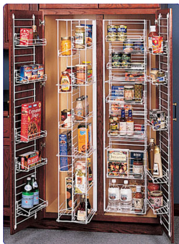
Gambar 2 Storage yang Efisien

Keempat, sirkulasi. Jarak sirkulasi koridor antara area kerja satu dan yang lain, juga perlu diperhatikan. Jika terlalu sempit, akan membuat dapur terasa sempit dan tidak nyaman. Masih dari Martin Edic dan Richard Edic (Aini, 2013) disebutkan bahwa jarak optimal yang sebaiknya diaplikasikan adalah 94cm. Hal ini paling dapat terlihat penerapannya pada bentuk layout dapur island . Di sana sirkulasi antara area kerja dengan bagian belakang perlu diperhatikan agar kedua aktivitas dapat berjalan dengan baik.