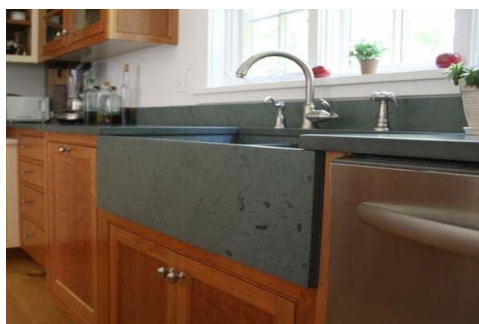
Gambar 3 Ketinggian Ideal Tempat Cuci

Kelima, tinggi bak cuci. Area berikutnya adalah area cuci piring ( kitchen sink ). Imelda Akmal (Aini, 2013) menuliskan bahwa tinggi bak cuci sebaiknya antara 70cm - 80cm dari lantai. Jadi pengguna tidak perlu membungkuk untuk menjangkau dasar bak.