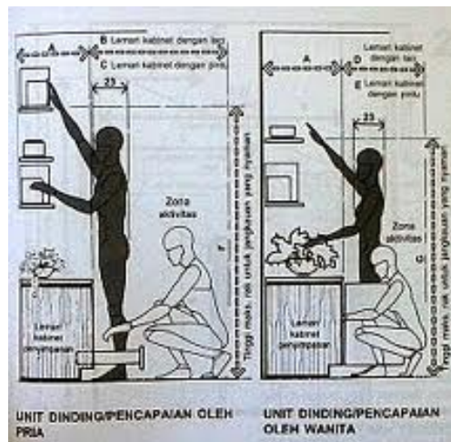
Gambar 1 Daya Jangkau Kabinet

Kedua, daya jangkau. Permukaan meja kerja juga harus diperhatikan lebarnya. Daya jangkau tangan manusia, khususnya wanita, ke depan adalah 85 cm. Sementara ke samping antara 42cm - 62cm. Daya jangkau dalam bekerja akan memengaruhi efektivitas bekerja. Selain itu, daya jangkau juga memengaruhi ketahanan tubuh dan lama bekerja. Gambar 1 menunjukkan ukuran untuk daya jangkau kabinet.