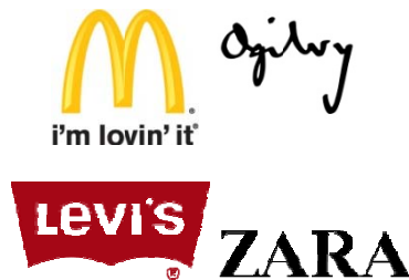
Gambar 1 Contoh Logotype

Pemilihan tulisan atau gambar yang akan dipakai untuk sebuah logo harus disesuaikan berdasarkan fungsinya, tidak hanya berdasarkan nilai estetis. Memilih menggunakan tulisan saja jika: (1) memiliki nama yang sudah baik, unik, dan berbeda serta populer di masyarakat; (2) ingin membuat orang lebih fokus pada namanya saja; (3) ingin membuat orang lebih jelas menangkap hubungan antara sub brand dengan master brand -nya.