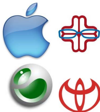
Gambar 2 Contoh Logogram

Memilih menggunakan gambar saja jika: (1) nama yang dimiliki banyak dipakai atau mirip dengan perusahaan lain; (2) nama terlalu panjang atau sulit diterjemahkan ke bahasa lain; (3) nama kurang menggambarkan brand personality -nya; (4) ingin menerapkan gambar pada media tertentu.