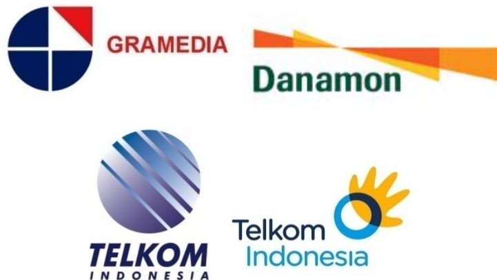
Gambar 3 Contoh Logo Perusahaan yang Berubah

Kepopuleran Feng shui sejak tahun 1980-an membuat banyak perusahaan, terutama perusahaan swasta, beramai-ramai mengganti logo dengan harapan akan memperoleh keuntungan lebih banyak. Dan memang tidak sedikit dari perusahaan tersebut yang menjadi lebih sukses setelah logo mereka berubah. Contohnya Bank BII, Bank Danamon, Bank BNI, Gramedia, dan lain-lain.