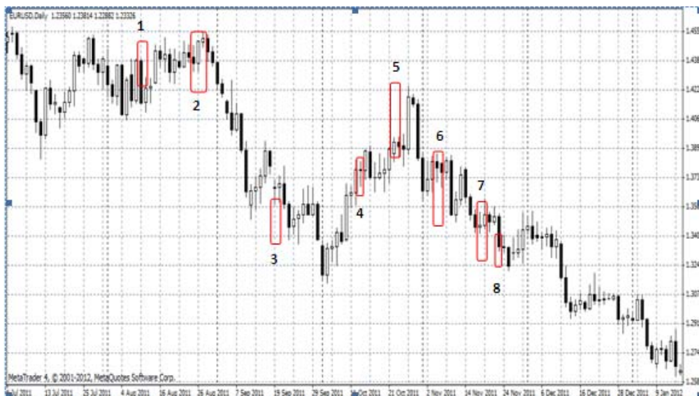
Gambar 8 EUR/USD Juli – Desember 2011