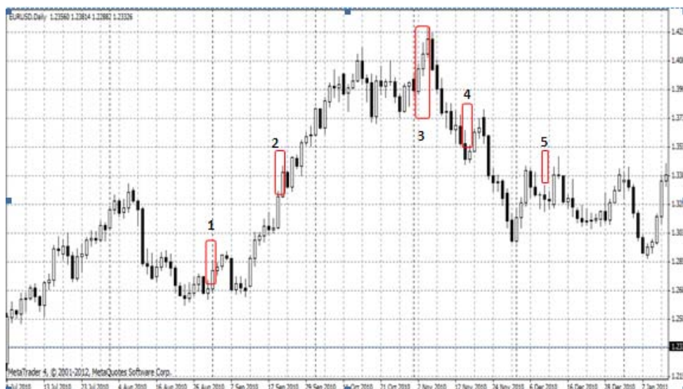
Gambar 6 EUR/USD Juli – Desember 2010