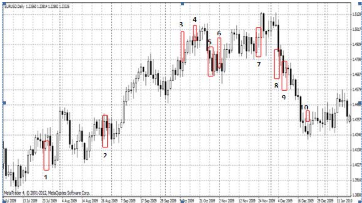
Gambar 4 EUR/USD Juli 2009 – Januari 2010