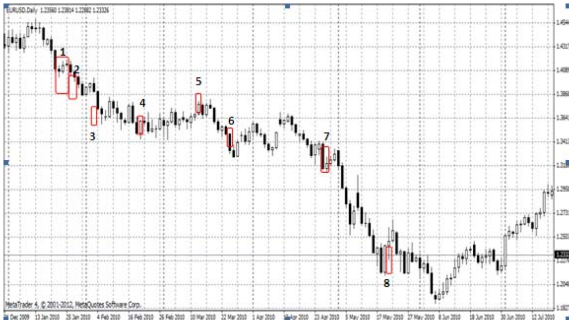
Gambar 5 EUR/USD Januari – Juli 2010