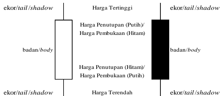
Gambar 1 Contoh Grafik Candlestick

Yang harus diperhatikan adalah pada batang bullish , harga pembukaan terletak di badan bagian bawah dan harga penutupan terletak di badan bagian atas, sedangkan pada batang bearish sebaliknya. Pada bagian ekor (ada yang menyebut juga bayangan/ shadow ) terletak informasi mengenai harga tertinggi (ujung ekor atas) dan harga terendah (ujung ekor bawah). Dengan memahami hal tersebut, pembaca grafik dapat cepat menyesuaikan diri dengan warna apapun yang ditampilkan oleh sebuah software grafik.