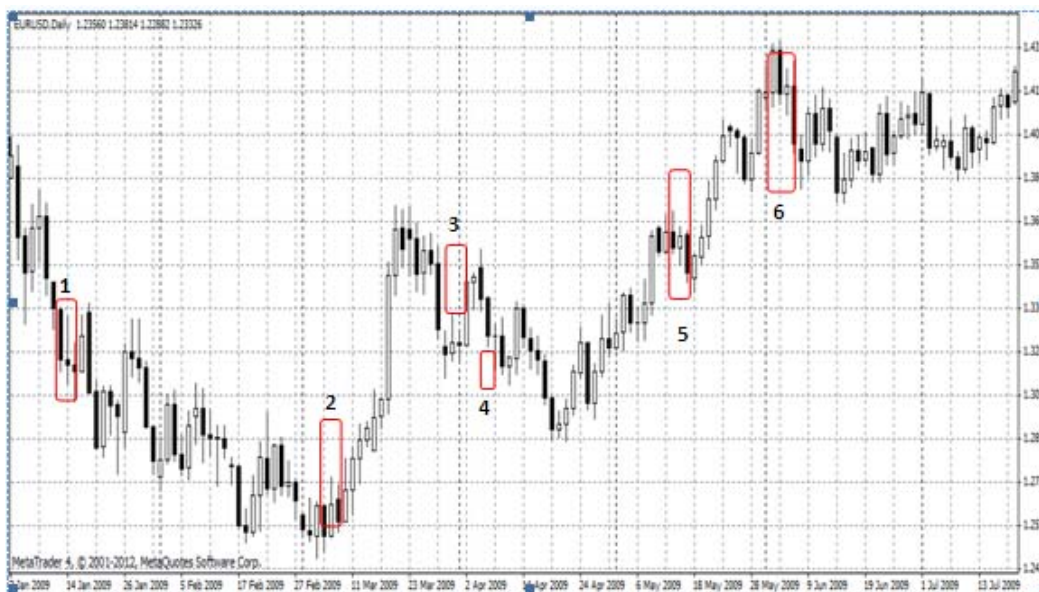
Gambar 3 EUR/USD Januari – Juli 2009

Pada bagian ini akan diulas pola candlestick yang muncul atas pergerakan EUR terhadap USD (disingkat EUR/USD). Metode penjelasan yang akan dilakukan adalah melalui gambar dan uraian penjelasan atas gambar tersebut. Setiap pola yang muncul akan ditandai dan diberi nomor. Pada bagian penjelasan akan diuraikan nama pola yang terjadi keterangan yang diperlukan.