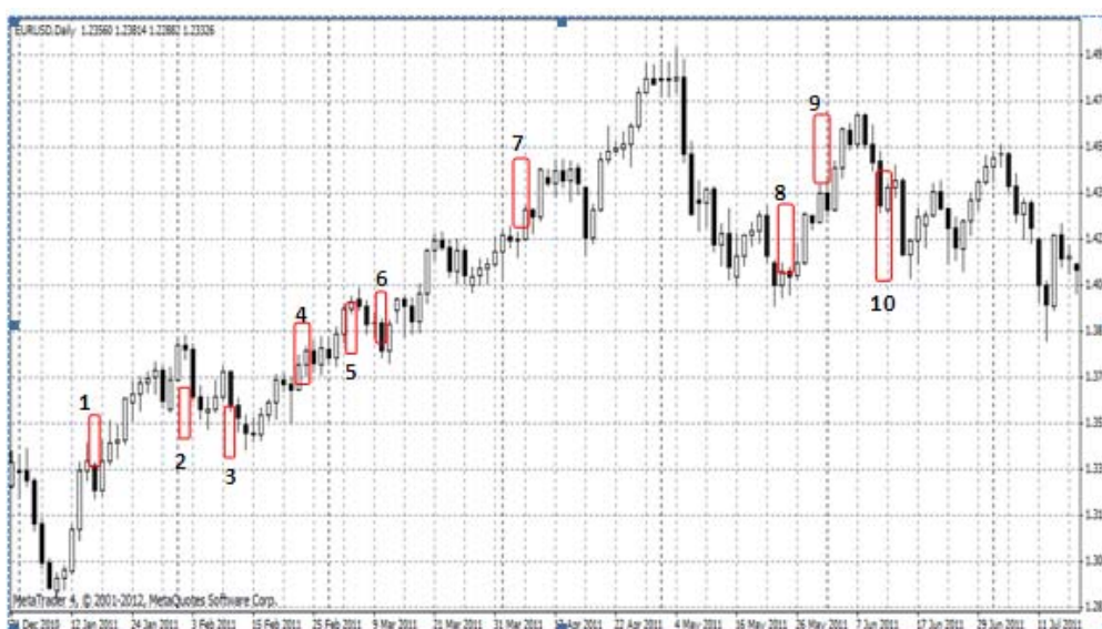
Gambar 7 EUR/USD Januari – Juli 2011