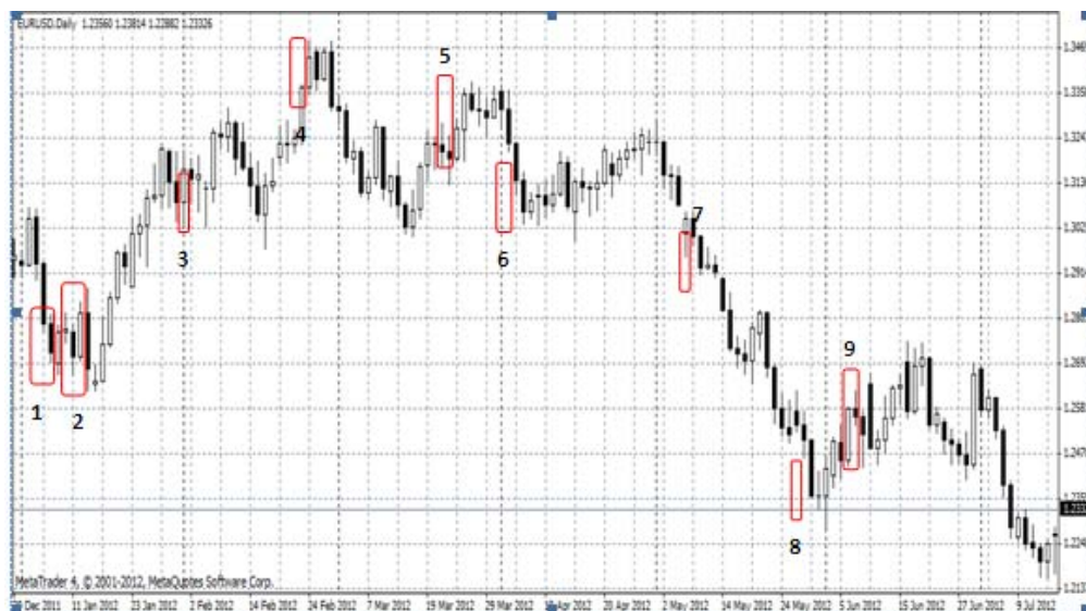
Gambar 9 EUR/USD Januari – Juli 2012