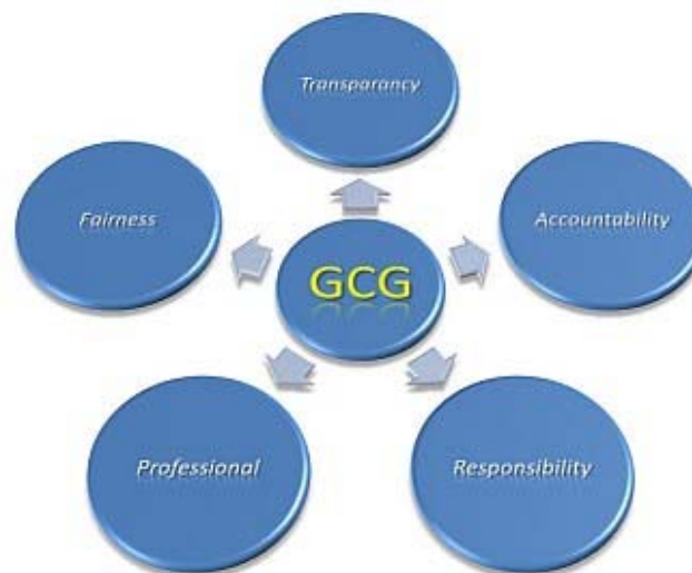
Gambar 2 Prinsip GCG

Menurut Bhatta (1996), prinsip-prinsip GCG dapat dibagi sebagai berikut. Accountability (akuntabilitas), yaitu kejelasan fungsi, struktur, sistem, dan pertanggungjawaban organ perusahaan sehingga pengelolaan perusahaan terlaksana secara efektif. Transparency (keterbukaan informasi), yaitu keterbukaan dalam melaksanakan proses pengambilan keputusan dan keterbukaan dalam mengemukakan informasi materiil dan relevan mengenai perusahaan. Responsibility (pertanggungjawaban), yaitu kesesuaian (kepatuhan) dalam pengelolaan perusahaan terhadap prinsip korporasi yang sehat serta peraturan perundangan yang berlaku. Independency (kemandirian), yaitu suatu keadaan ketika perusahaan dikelola secara profesional tanpa benturan kepentingan dan pengaruh/tekanan dari pihak manajemen yang tidak sesuai dengan peraturan dan perundangan-undangan yang berlaku dan prinsip-prinsip korporasi yang sehat. Fairness (kesetaraan dan kewajaran), yaitu perlakuan yang adil dan setara di dalam memenuhi hak-hak stakeholder yang timbul berdasarkan perjanjian serta peraturan perundangan yang berlaku. Esensi dari corporate governance adalah peningkatan kinerja perusahaan melalui supervisi atau pemantauan kinerja manajemen dan adanya akuntabilitas manajemen terhadap pemangku kepentingan lainnya, berdasarkan kerangka aturan dan peraturan yang berlaku.